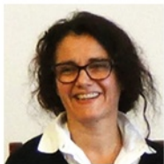
Ospite: Lidia Maggi, biblista e pastora battista